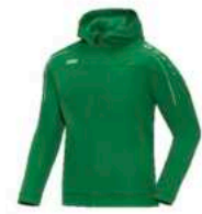
JAKO Kapuzenjacke Classico mit Kapuze inkl. Hose (schwarz)

Artikelnummer: 9350-06 Polyester Inkl. Logo & Vereinsname 35€ bis Größe 164 40€ ab Größe S 25€ nur die Jacke