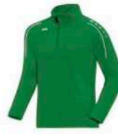
JAKO Ziptop Classico

Artikelnummer: 6765-06 Baumwolle Inkl. Logo 30€ bis Größe 164 35€ ab Größe S