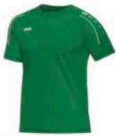
JAKO Shirt Classio Kurzarm

Artikelnummer: 6150-06 Polyester Inkl. Logo & Vereinsname 15€ bis Größe 164 20€ ab Größe S