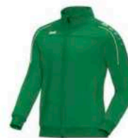
JAKO Trainingsanzug Polyester Classico inkl. Hose (schwarz)

Artikelnummer: 8650-06 Polyester Inkl. Logo & Vereinsname 25€ bis Größe 164 30€ ab Größe S