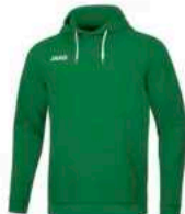
JAKO Kapuzensweat Base

Artikelnummer: 6350-06 Polyester Inkl. Logo & Vereinsname 20€ bis Größe 164 25€ ab Größe S