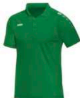
JAKO Polo Classico

Artikelnummer: 6150-06 Polyester Inkl. Logo & Vereinsname 15€ bis Größe 164 20€ ab Größe S