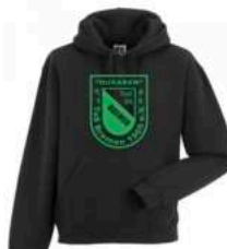
TuS Bremen Hoodie

Artikelnummer: 8489-800 Polyester 20€ bis Größe 164 25€ ab Größe S